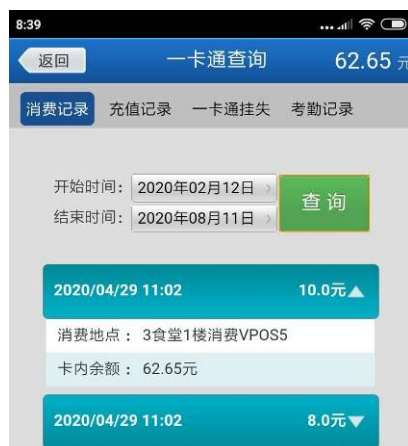
图 13 一卡通消费查询

在一卡通查询中，可以按日期查询一卡通的消费、充值、考勤记录，并提供一卡通挂失功能，界面如图 13 所示。