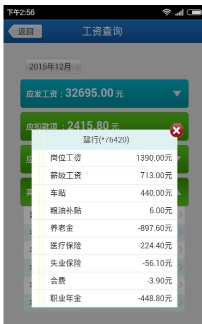
图 12 工资查询系统明细查询

按月查询界面显示了应发工资、应扣款项、应缴税收和实发工资的情况，点击“>”符号的条目可展开查询明细，实发工资中显示包括工资卡、扣款扣税等发放明细，如图 12 所示。