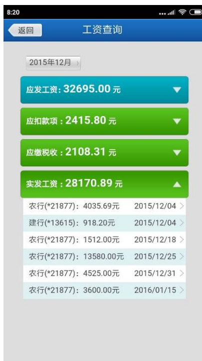
图 11 工资查询系统按月查询

按月查询界面显示了应发工资、应扣款项、应缴税收和实发工资的情况，点击“>”符号的条目可展开查询明细，实发工资中显示包括工资卡、扣款扣税等发放明细，如图 12 所示。