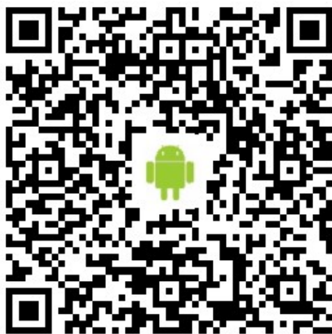
图 1 扫描二维码安装 i 海大应用