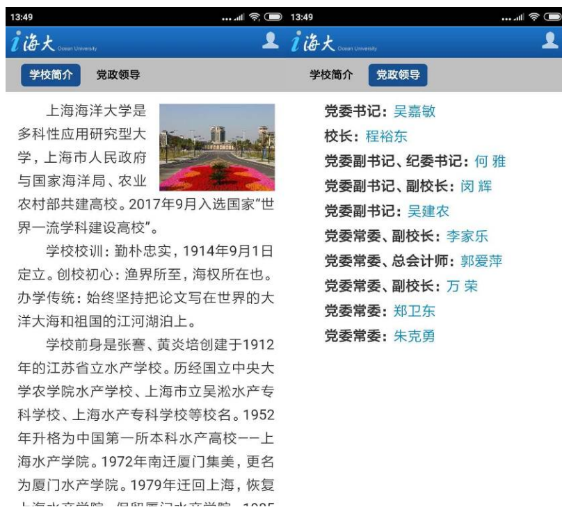
图 6 学校简介和党政领导介绍

点击顶部菜单即可在“学校概况”和“党政领导”之间进行切换。点击图 6 右上角的头像即可进入如图 5 所示界面。