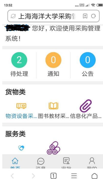
图 17 采购系统