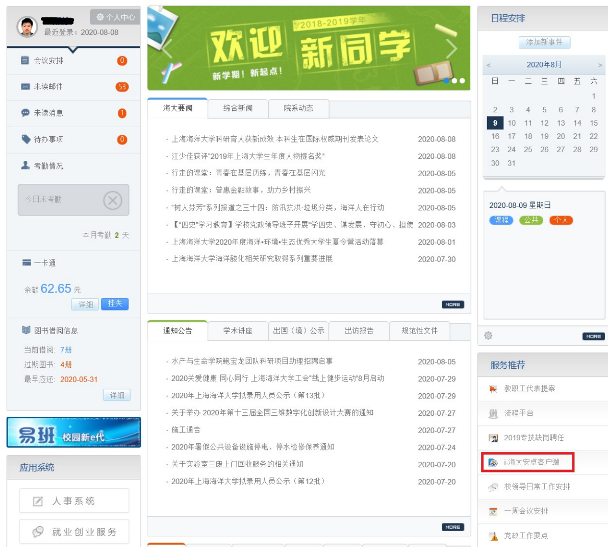
图 2i 海大下载位置