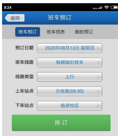
图 7 班车预订