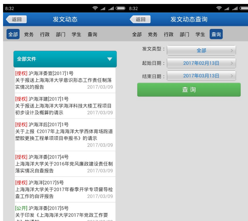
图 14 发文动态查看图 15 发文动态检索

发文动态系统提供 OA 发文查询和检索功能，点击即可用默认浏览器打开发文。界面如图 14 和图 15 所示。