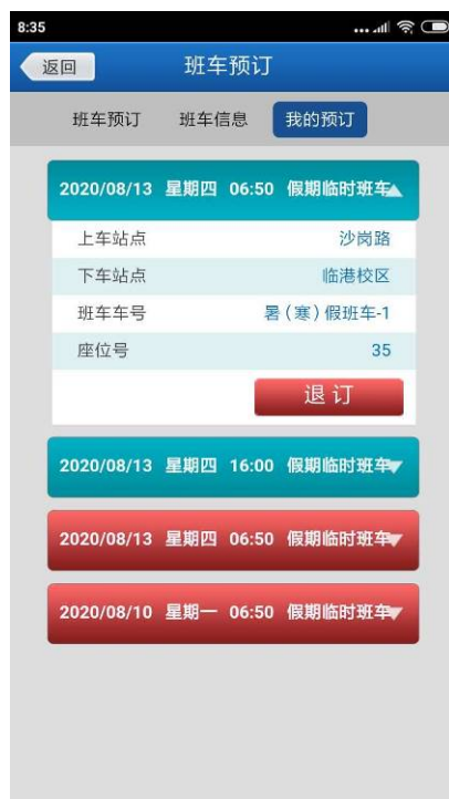
图 9 预订查询和退订