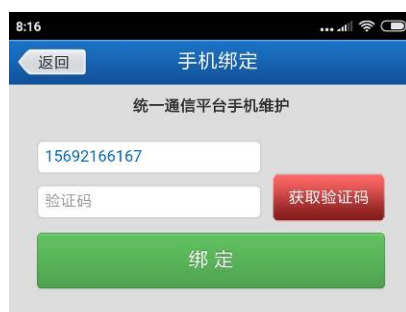
图 18 手机绑定

手机绑定功能界面如图 18 所示。用户可通过该功能修改统一通信平台中的个人信息，具体步骤为：1. 修改手机号码→2. 获取验证码→3. 填入正确验证码后点击“绑定”按钮。