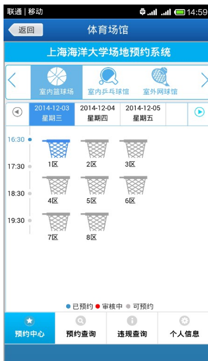
图 16 体育场馆预约系统

i海大集成了新的体育场馆系统，点击图5中“体育场馆”可进入到体育场馆预约系统，界面如图16所示。