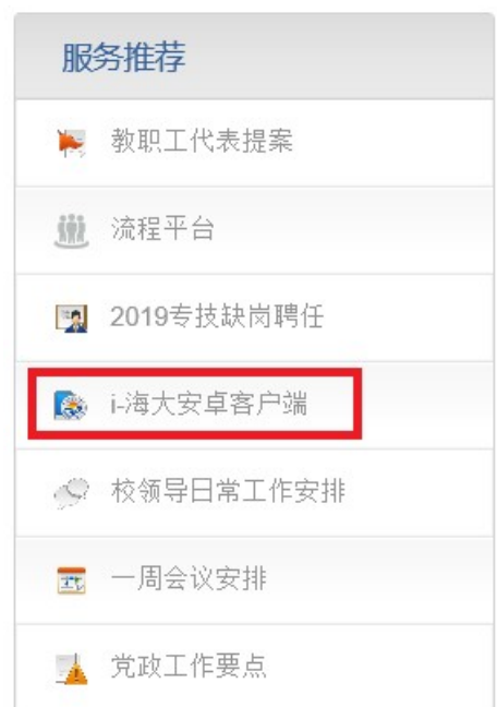
图 3i 海大下载具体位置