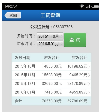
图 10 工资查询系统多月汇总查询

该系统数据与学校财务系统同步。在工资查询系统中可进行多月汇总、单月明细、单笔发放明细等多种方式查询。系统初始界面及多月汇总查询如图 10。