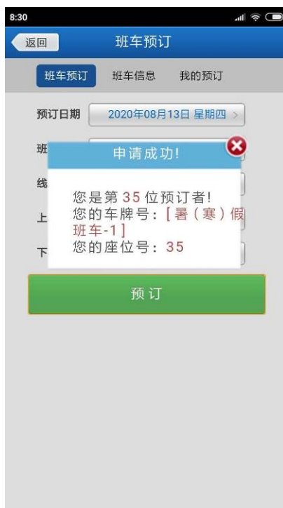
图 8 预订成功